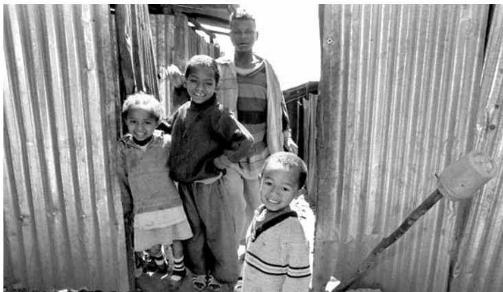
Straatkinderen in een sloppenwijk.

Deze kinderen hebben geen huis. Ze eten, slapen en leven op straat. Altijd. Dag en nacht. Vandaar dat ze kinderen VAN de straat genoemd worden. Sommige kinderen hebben nog wel familie, maar zien die eigenlijk nooit meer. 's Nachts slapen ze in een kartonnen doos op het station, in een portiek of zomaar ergens. De andere straatkinderen vormen nu een nieuw soort familie voor hen. Dit biedt hen een gevoel van veiligheid.