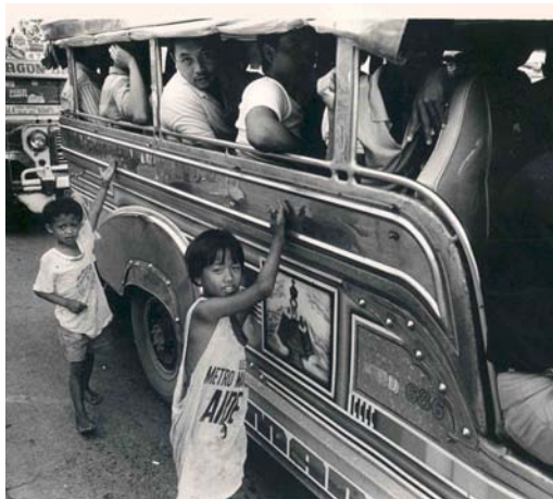
Je hand ophouden en bedelen om geld?

Om een beetje geld bij elkaar te krijgen om te eten en te drinken gaan veel kinderen bedelen. Bedelen levert helaas weinig op. Zeker als de kinderen wat ouder zijn, geven de mensen niets meer.