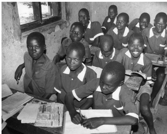
Zal in 2015 ieder kind naar school kunnen?