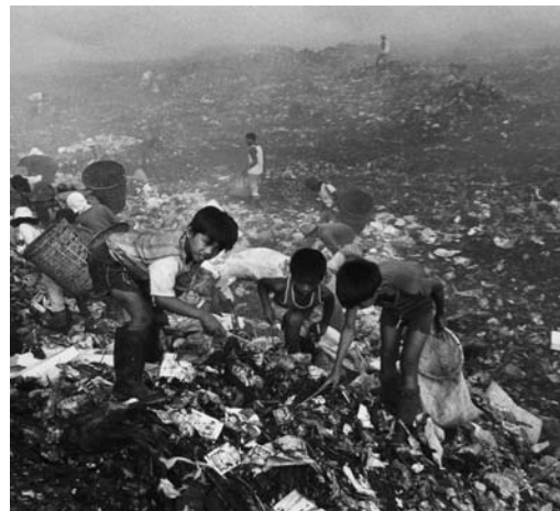
Of iets van waarde zoeken op de vuilnisbelt?