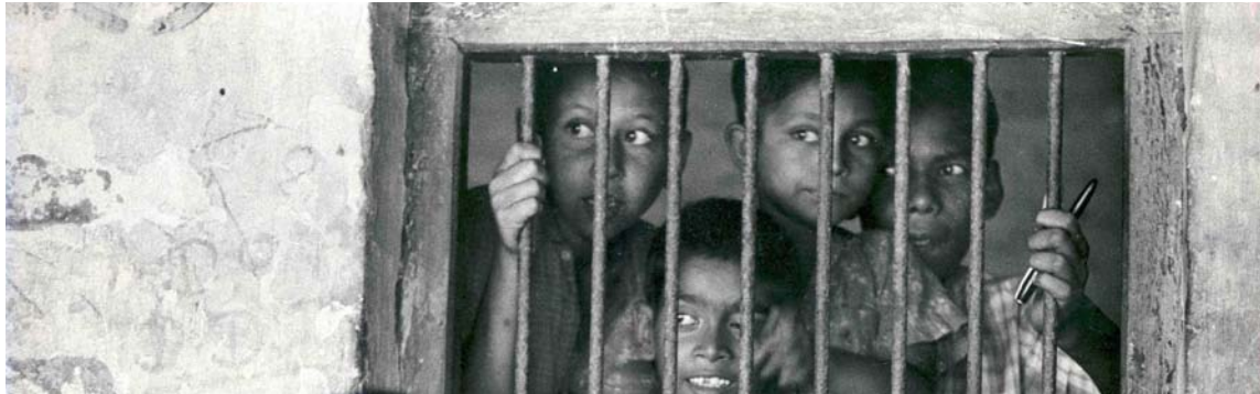
Veel straatkinderen belanden in de gevangenis. Wie haalt ze eruit?

De kinderen hebben het meeste te vrezen van rijke burgers en de politie. Politieagenten deinen niet terug om geweld te gebruiken en de kinderen te mishandelen. Vervolgens worden ze aan hun lot overgelaten. Ook worden de kinderen vaak zonder reden opgepakt en belanden ze in de gevangenis. In de gevangenis worden zij slecht behandeld en ook nog eens mishandeld.